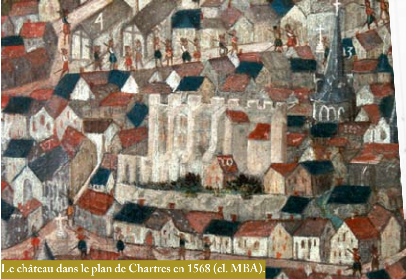
Le château dans le plan de Chartres en 1568.

Dans son Histoire chronologique de la Ville de Chartres (1528-1700) , le Chartrain Alexandre Pintard (1633-1708) décrit ainsi le « Palais »