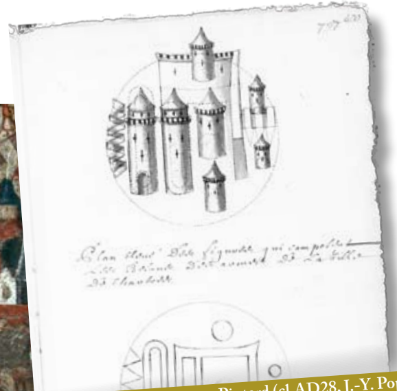
Dessin de la « Tour » par Pintard

laquelle est la chapelle dédiée à st Blanchard et les entrées des chambres d'audience du bailliage et de la prévosté et de la chambre criminelle qui y sont jointes. Le dessous sert de prisons et de cachots. Ce qui reste de bâtimens n'est qu'une partie de cette tour qui a esté ruinée par les guerres. Lors qu'elle bornoit l'étendue de la ville en cet endroit, elle coupoit la muraille et avoit sa sortie libre au-dedans et au dehors. La justice du bailliage et siège présidial de Chartres tant civile que criminelle et celle de la prévosté qui s'étend sur la ville et sur la banlieue s'exercent chacune dans des chambres particulière de cet enclos et celle de l'élection, pour les affaires de finance, dans un pavillon bâti sur le portail d'entrée de ce palais.»