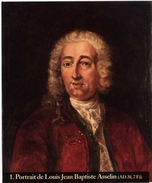
1. Portrait de Louis Jean Baptiste Asselin (AD 28, 7 F).

*La SAEL nous propose une série de portraits des maires de Chartres, avec ce mois-ci, le premier d'entre eux.