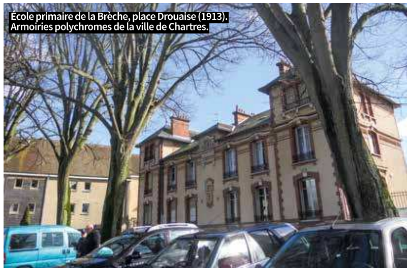
École primaire de la Brèche, place Drouaise (1913). Armoiries polychromes de la ville de Chartres.