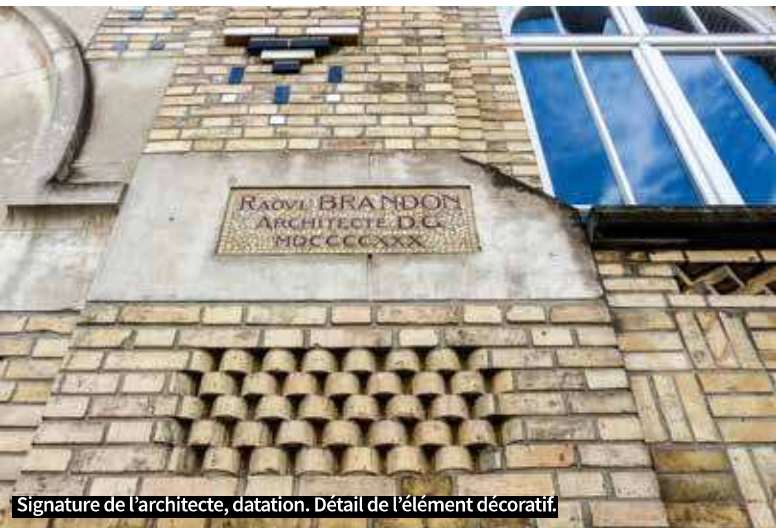
Signature de l'architecte, datation. Détail de l'élément décoratif.