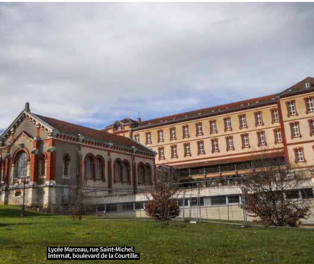
Lycée Marceau, rue Saint-Michel. Internat, boulevard de la Courtille.