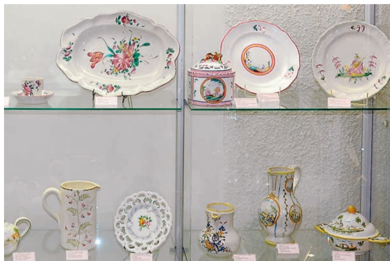
▲ Partie de vitrine consacrée à la faïence de Varages.

jusqu'au 23 décembre, au musée des Faïences, 12 place de la Libération. Ouvert du mercredi au dimanche de 14 h à 17 h. Tél. 04 94 77 60 39. Sept centres faïenciers sont représentés, alliant pièces anciennes et actuelles : Moustiers-Ste-Marie, Salernes, Apt, Marseille, Vallauris, Aubagne et Varages.