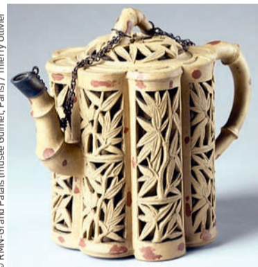
▲ Théière en grès. Chine, Yixing (Jiangsu), 18e siècle. H. 12,5 cm.