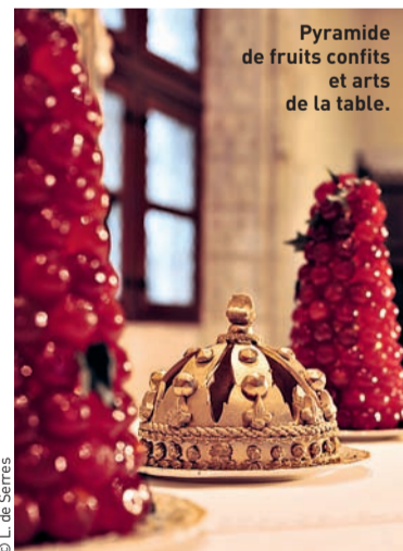
Pyramide de fruits confits et arts de la table.

à Amboise (37), du 1er décembre au 6 janvier, au château royal. Ouvert tous les jours sauf les 25 décembre et 1er janvier, de 9 h à 12 h 30 et de 14 h à 16 h 45. Tél. 02 47 57 00 98. Voyagez dans le temps à la découverte des croyances, chants, musiques, objets et décorations qui ont animé les fêtes de la Nativité depuis la Renaissance.