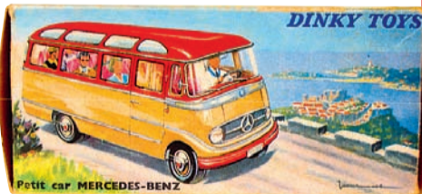
▲ Boîte du Car Mercedes Benz dans sa version bas de caisse crème et haut rouge. Années 1960.

Le Club Dinky France a sorti son 96e bulletin. Au sommaire : la Cadillac Coupé de Ville, la Simca 1000 Rallye, le Car Mercedes Benz et la Triumph 2000 dans leurs différentes versions, les affichettes des nouveautés de mars 1967, les rééditions, la nouveauté du club, les énigmes... Renseignements : Club Dinky France , BP 5117, 14079 Caen Cedex 5. E-mail : clubdinkyfrance@gmail.com