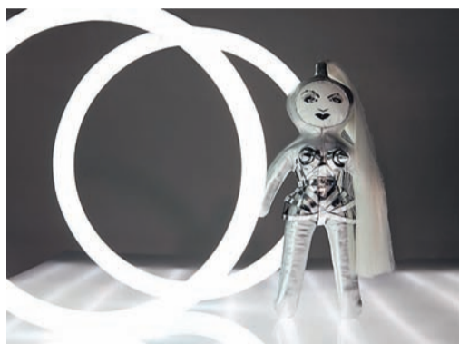
▲ "A star is born", poupée signée Jean-Paul Gaultier.

www.frimoussesdecreateurs.fr Cet événement caritatif organisé par l'UNICEF au profit des enfants du Darfour fête ses dix ans. Au programme, une exposition de poupées de créateurs de mode (Chanel, Dior, Vuitton, Thomass ...), joailliers, artistes contemporains et designers, couronnée par une vente aux enchères le 3 décembre (lire nos pages "Agenda").